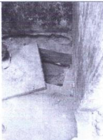
Registro de aguas residuales